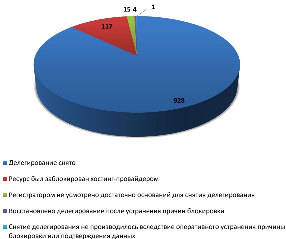
Рис.3 Итоги обработки обращений о снятии делегирования (сентябрь 2020)

В настоящее время остаются заблокированными 928 доменных имен (в 4 случаях делегирование было восстановлено по ходатайству соответствующей компетентной организации после устранения причины блокировки).